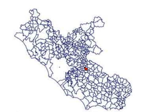
Comune di Bellegra (RM)